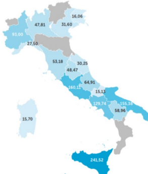
FIG. 5.58 Piano nazionale di ripresa e resilienza e REACT-EU: stato dei finanziamenti assentiti (aggiornamento a maggio 2022)

https://www.arera.it/it/eventi/22/220715ra.htm